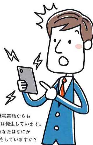
携帯電話からも電磁波は発生しています。あなたはなにか対策をしていますか？

しかし、残念ながら現在の文明社会は電磁波との共生を余儀なくされ、電磁波発生源機が際限なく身の回りに存在しています。